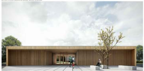
Fotografie exteriéru školy, která ukazuje moderní design a použití přírodních materiálů.