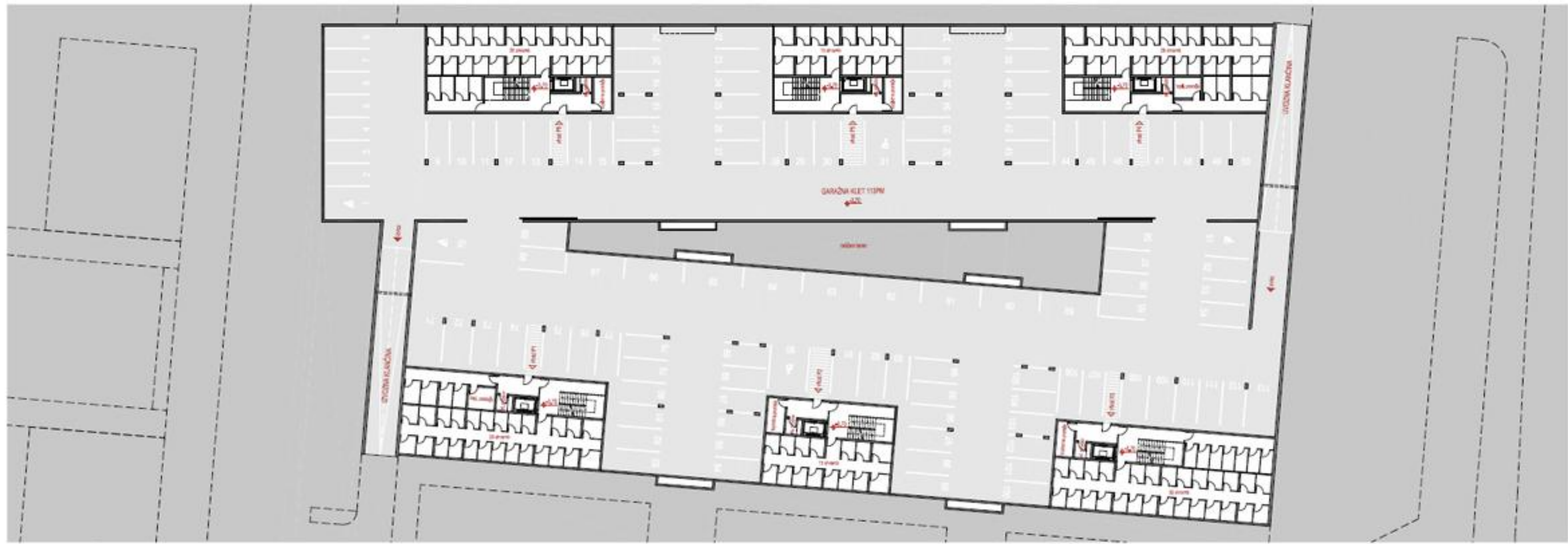
TLORIS GARAŽNE KLETI m 1:250