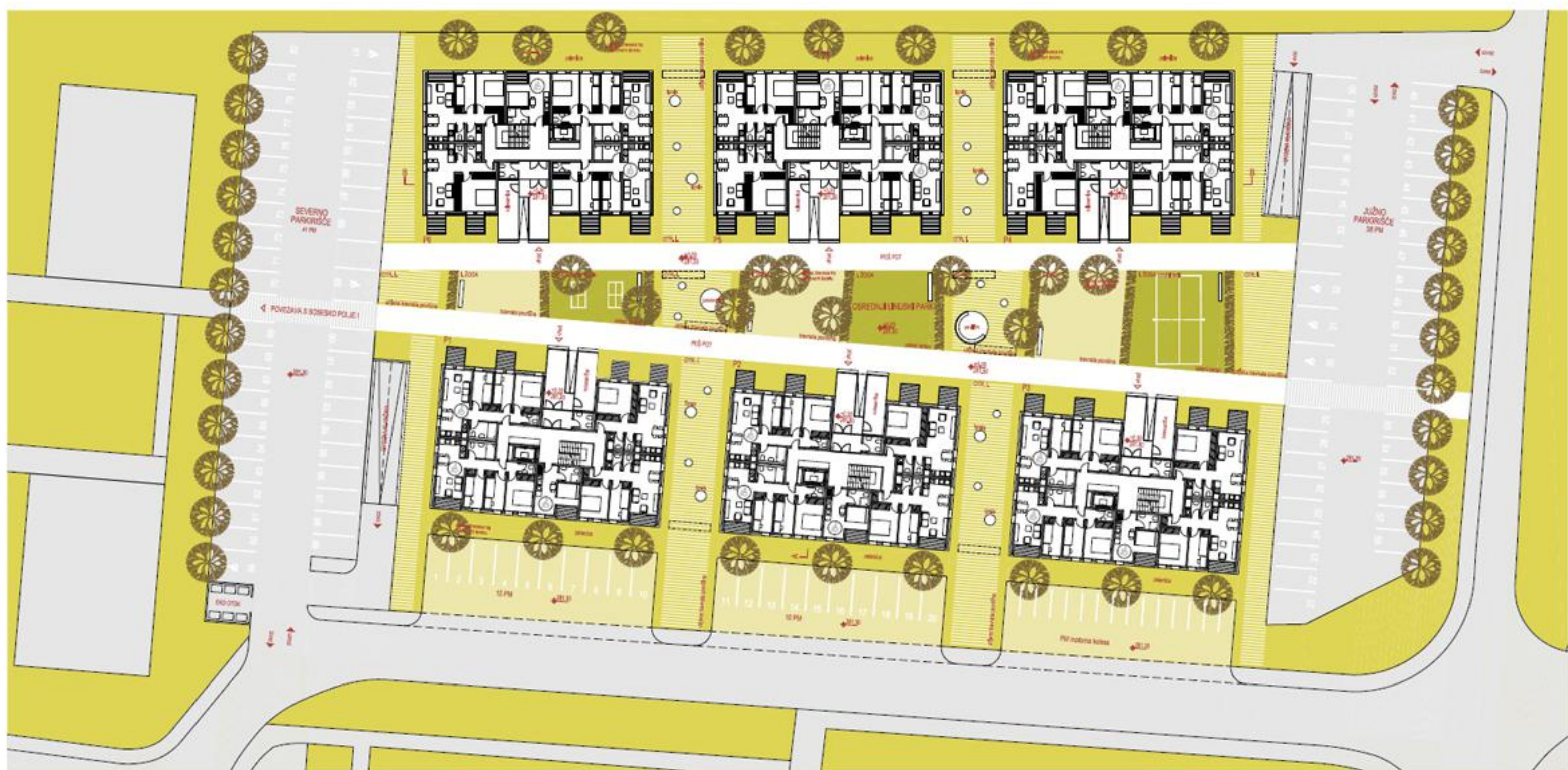
UREDITVENA SITUACIJA S TLORISI PRITLIČIJ m 1:250