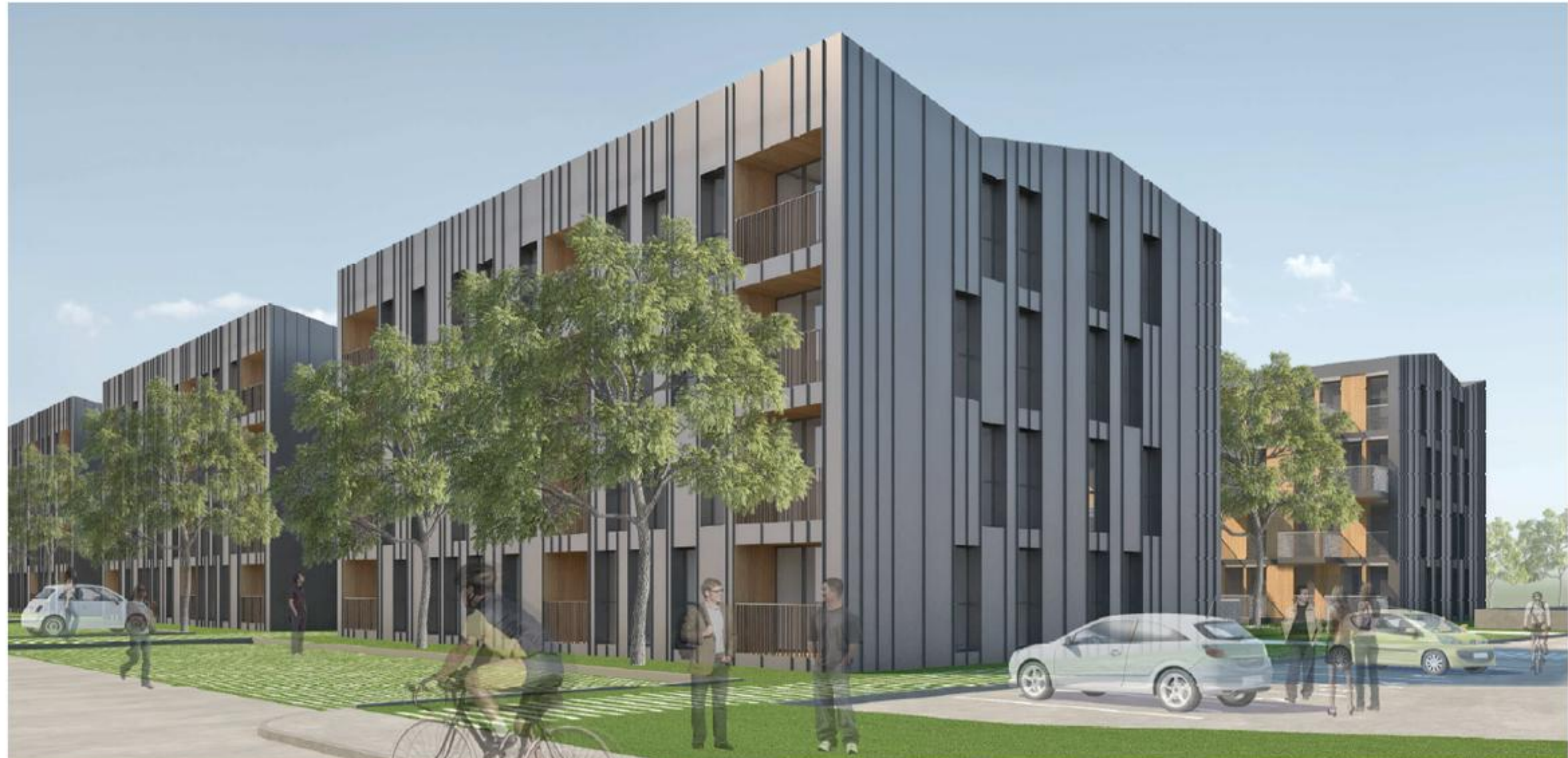
ZUNANJA TRDA FASADNA OPNA JE OBLIKOVANA KOT MONOLITEN OVOJ PERFORIRAN Z OKENSKIMI ODPRTINAMI IN LOŽAMI