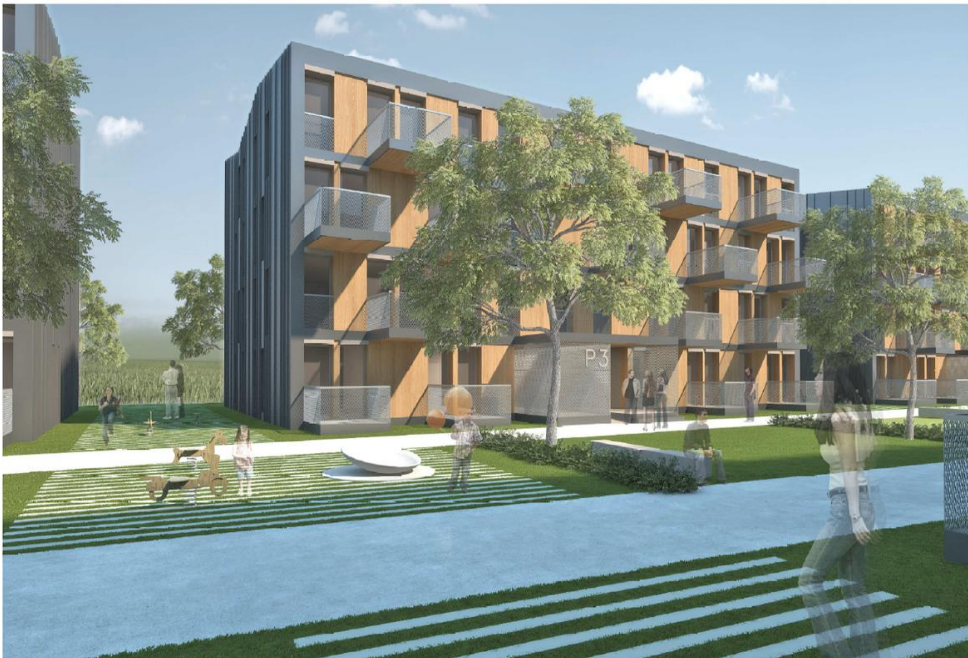
OSREDNJI LINJSKI PARK JE SEGMENTIRAN NA POVRŠINE ZA OTROŠKA IGRIŠČA IN POVRŠINE NAMENJENE IGRAM Z ŽOGO