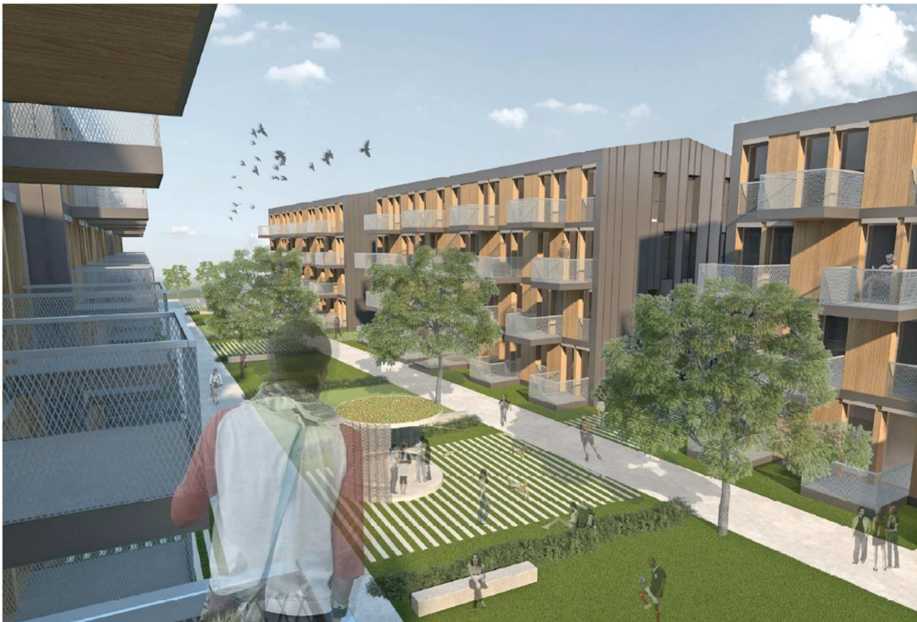
OSREDNJI PARK JE RAZMEJEN Z LINJSKO ZASAJENIMI GRMOVNICAMI TER NA RAŠČENEM TERENU ZASAJENIMI DREVESI