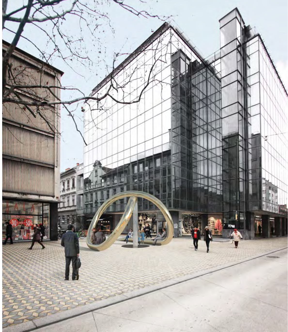
pogled na vodno skulpturo z jugovzhodne strani