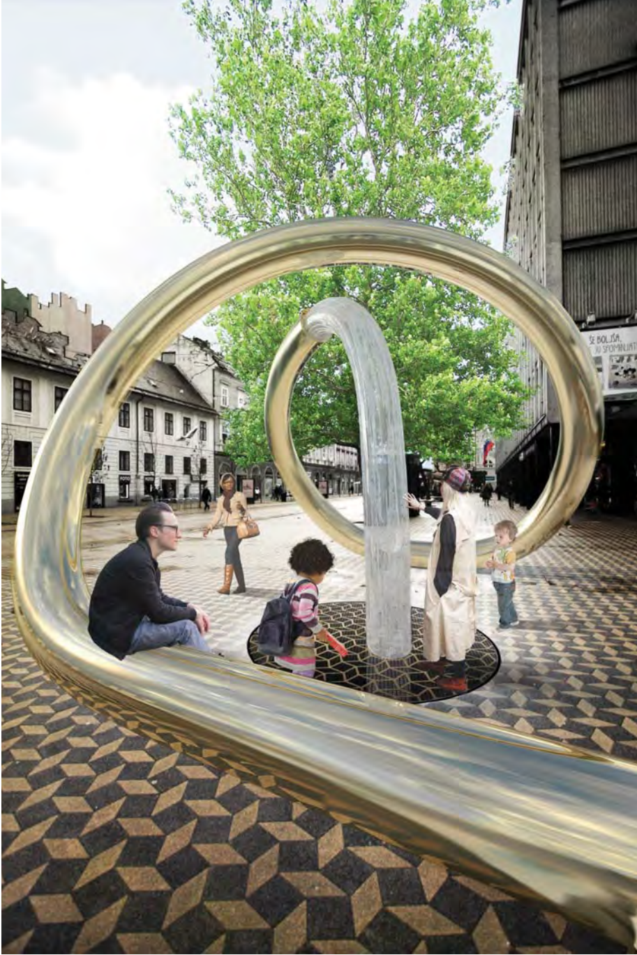
pogled na vodno skulpturo s severne strani piazzette