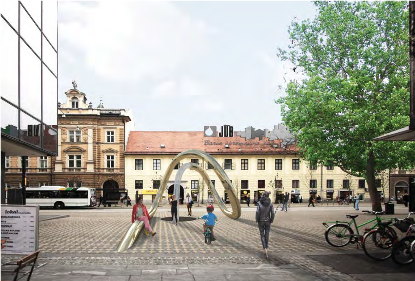
pogled skozi vodno skulpturo proti Knafljevem prehodu