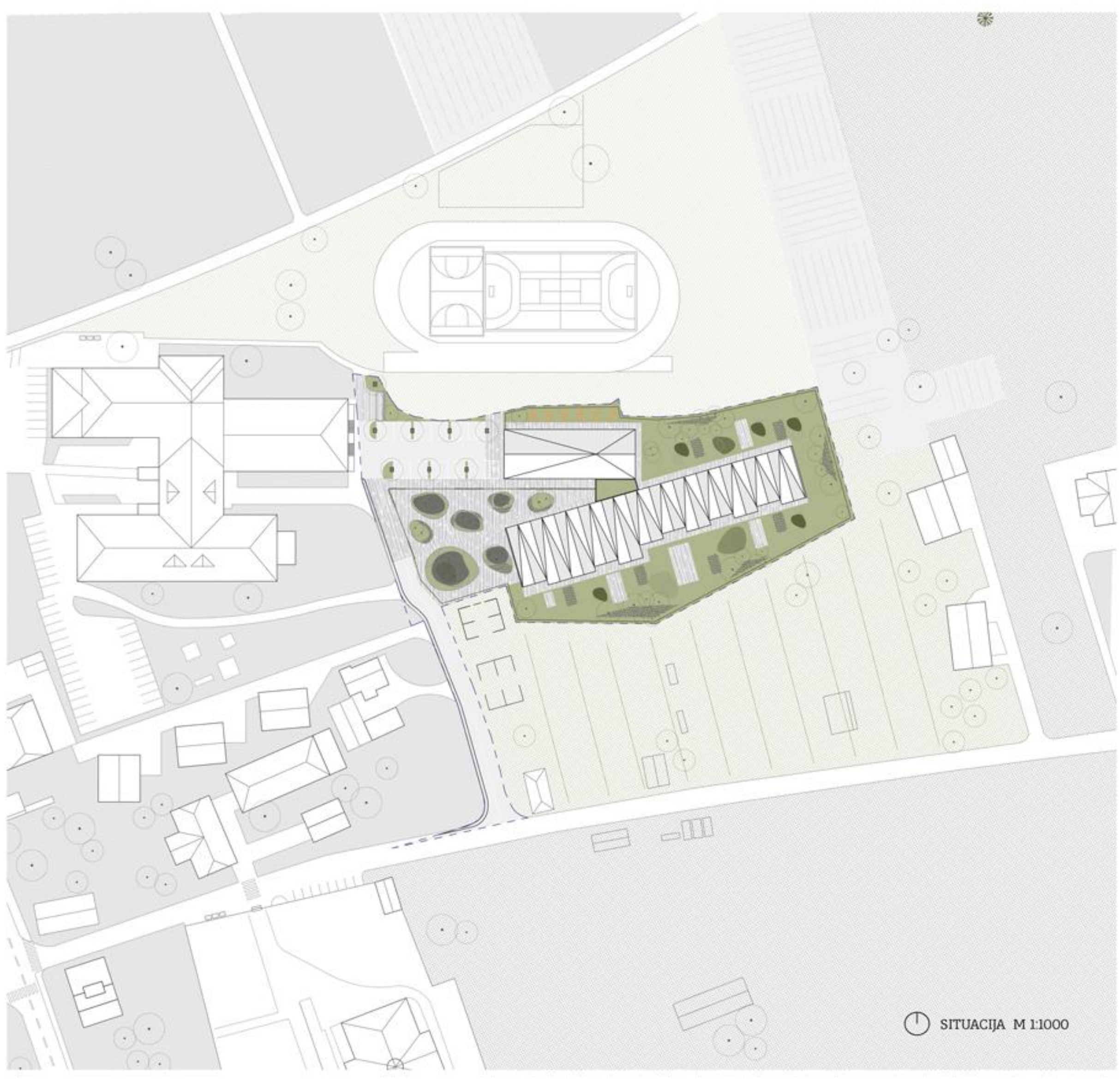
SITUACIJA M 1:1000