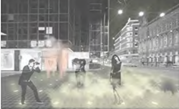
osvetljena megilna fontana ponoči