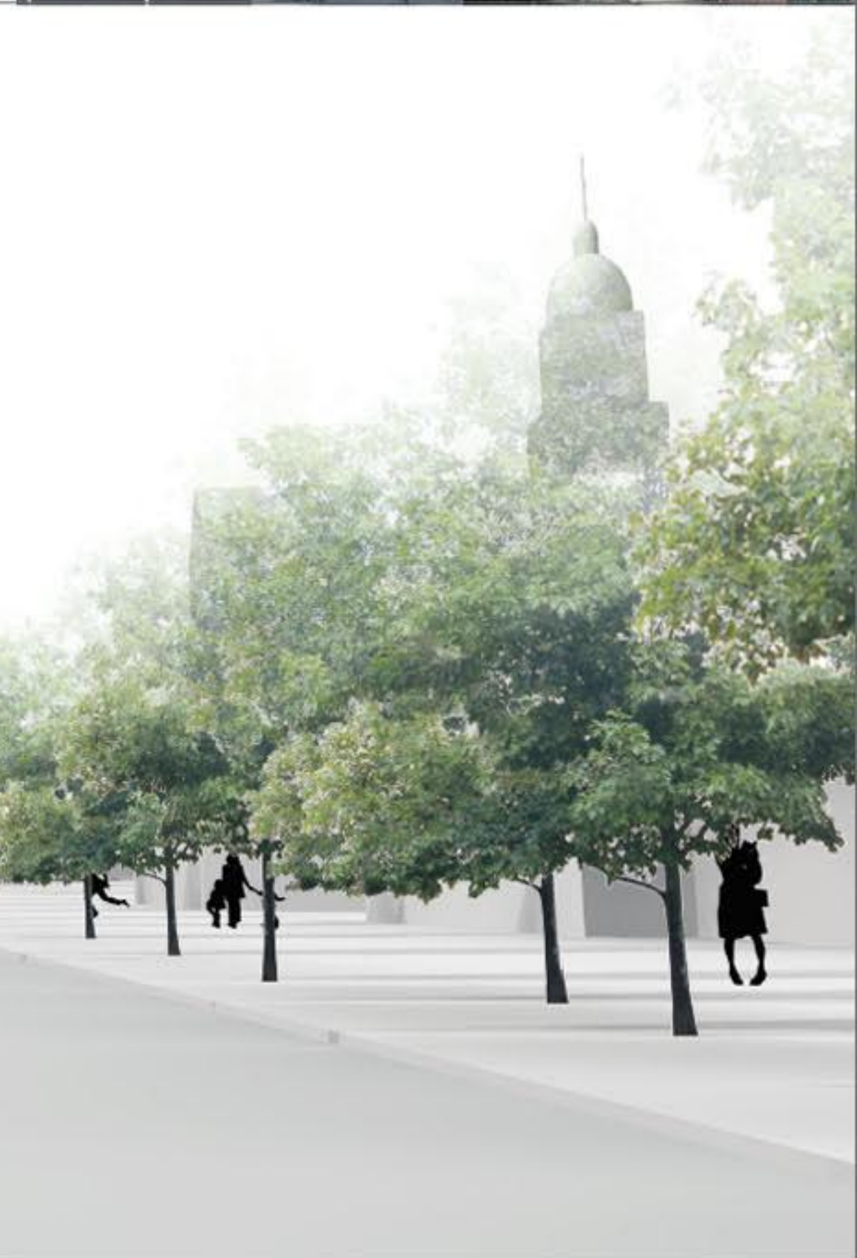
pogled vzdolž tržiške v smeri proti mestu