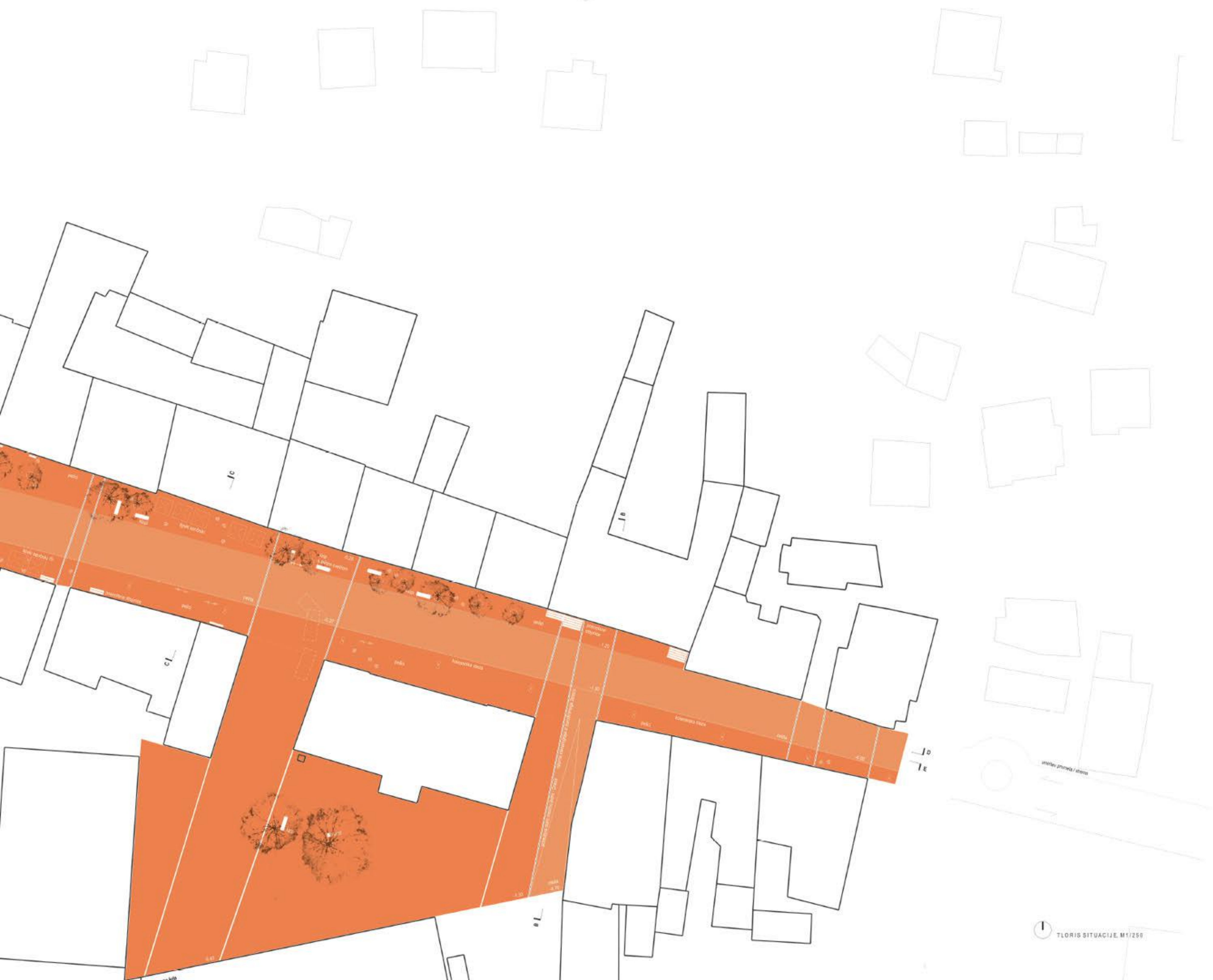
↑ FLORIS SITUACIJE, M1/250