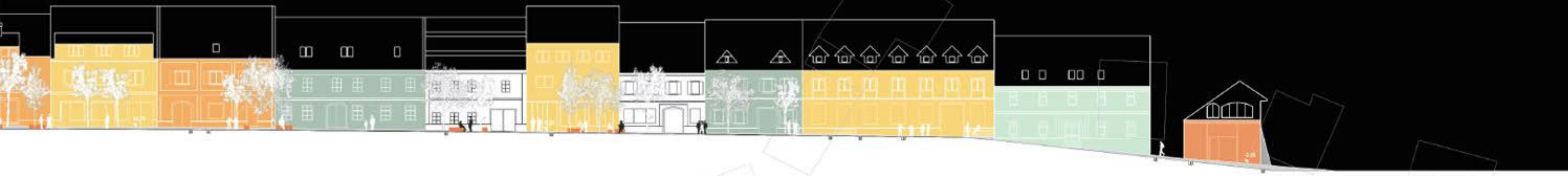
VZDOLŽNI PREREZ DO JUŽNI FASADNI PAS, M1/250