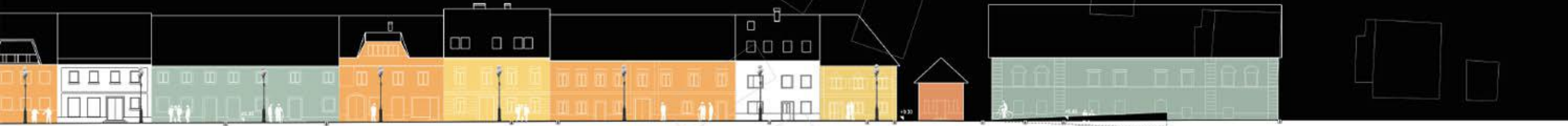
VZDOLŽNI PREREZ SE, SEVERNI FASADNI PAS, M1/250