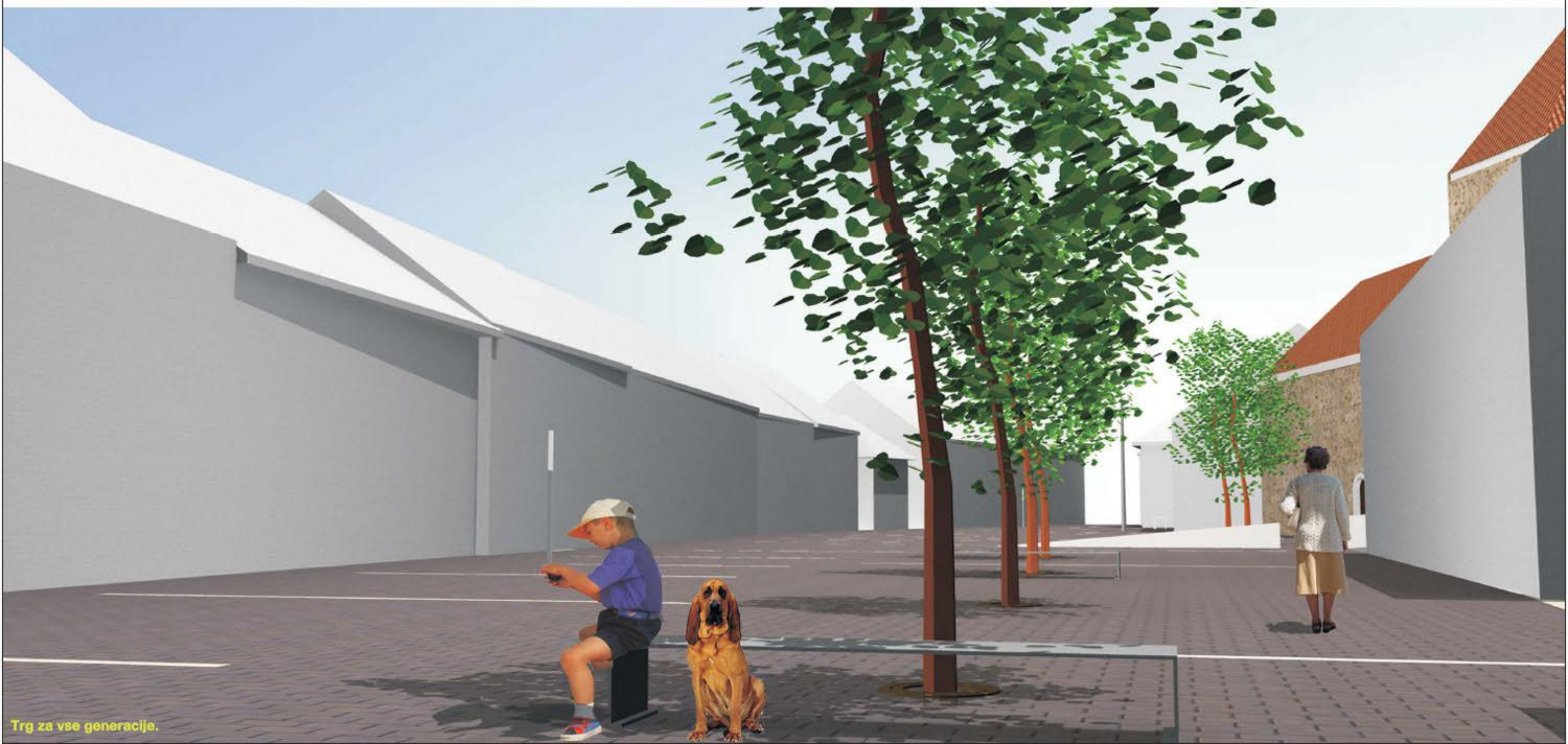
Trg za vse generacije.