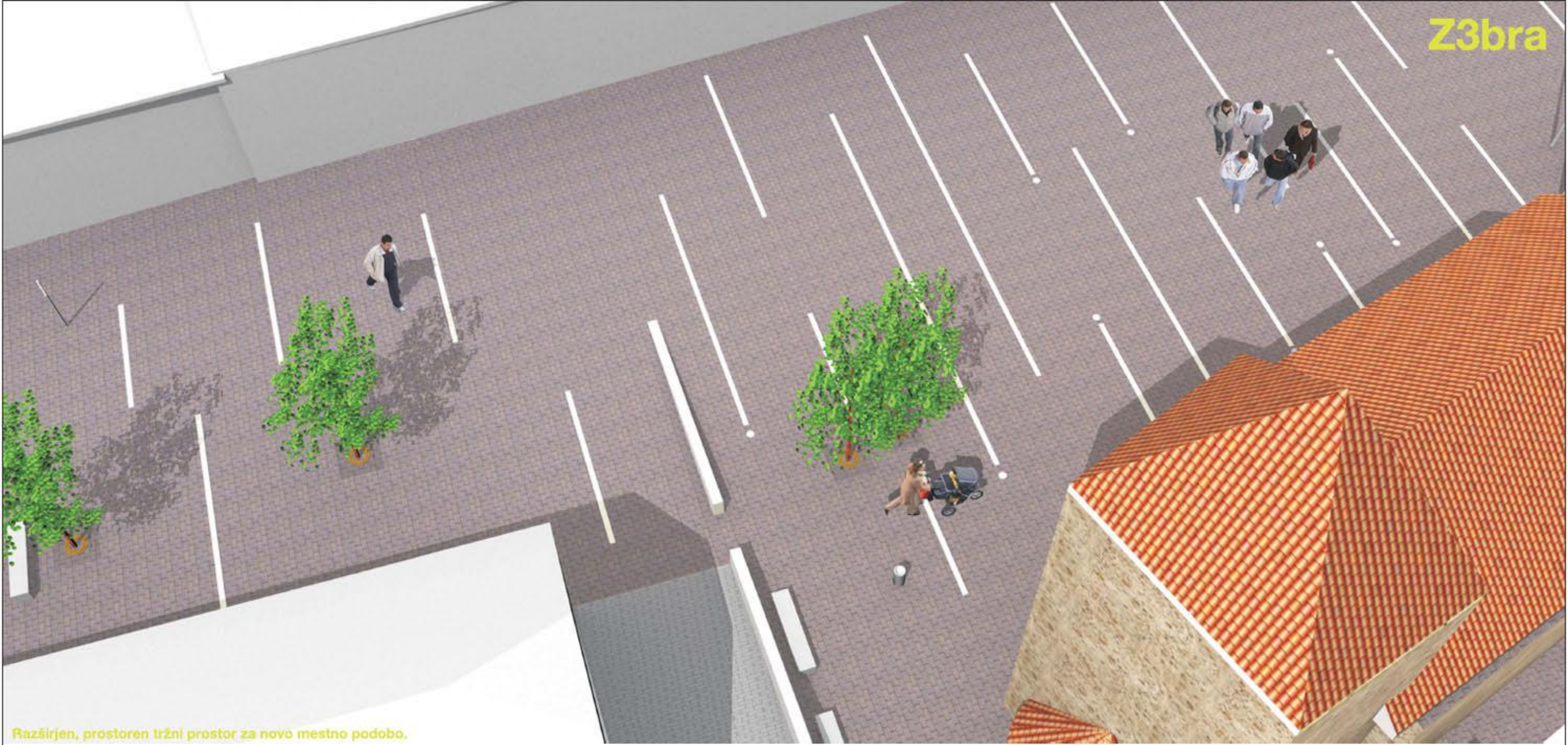
Razširjen, prostoren tržni prostor za novo mestno podobo.