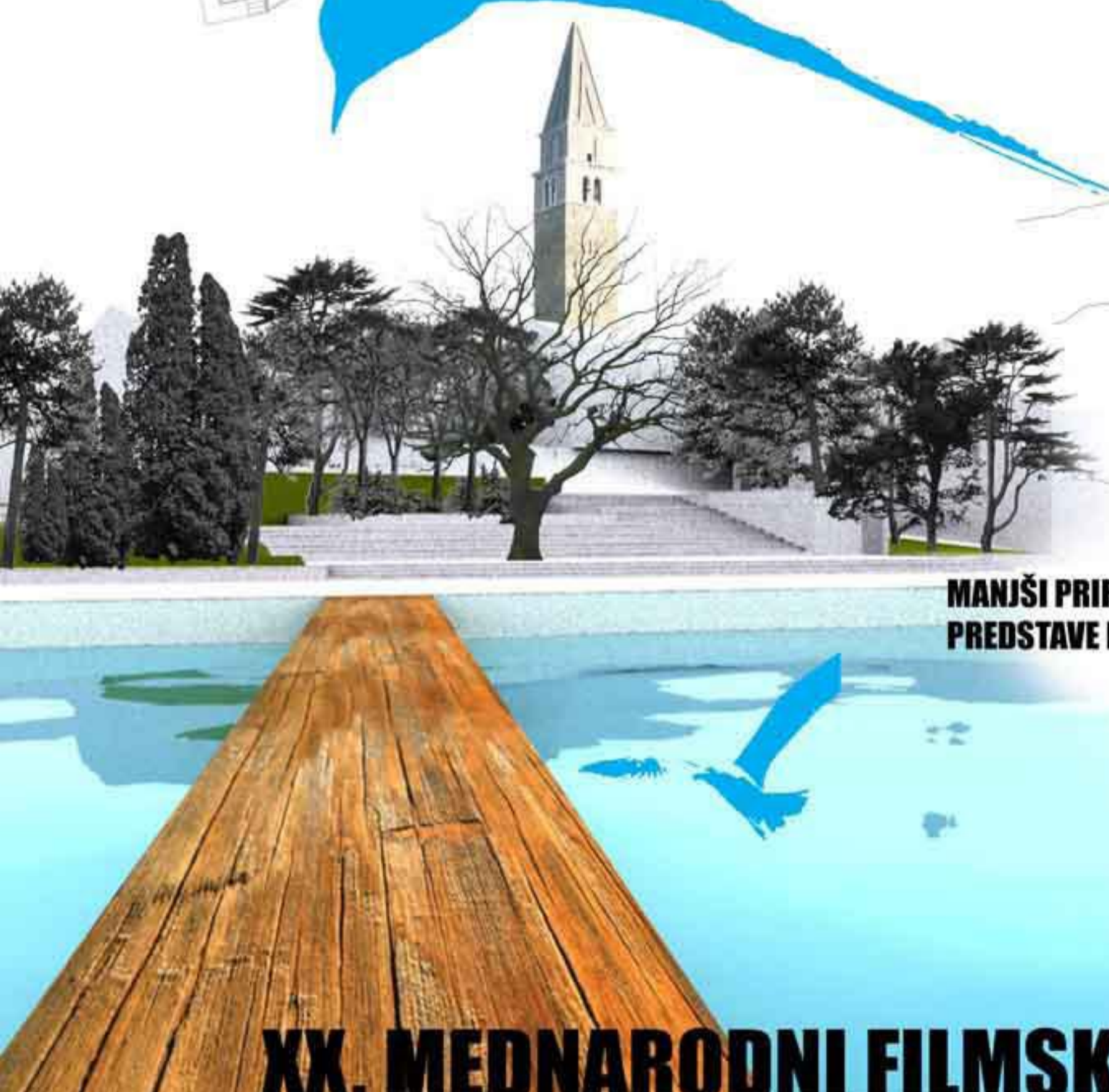
MANJŠI PRIREDITVENI PROSTOR PREDSTAVE NA VODI