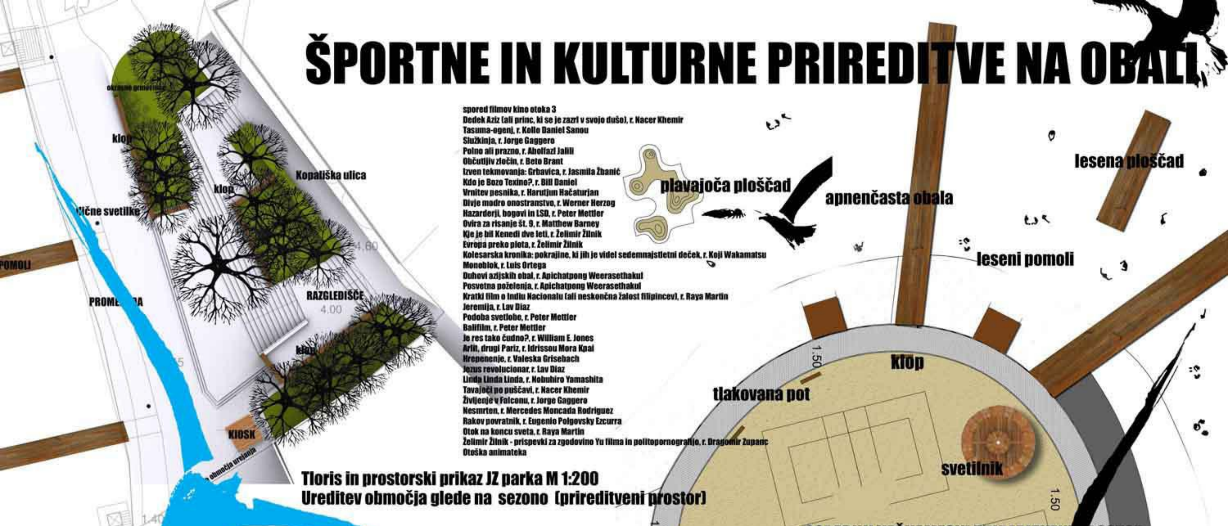
Tloris in prostorski prikaz JZ parka M 1:200 Ureditev območja glede na sezono (prireditveni prostor)