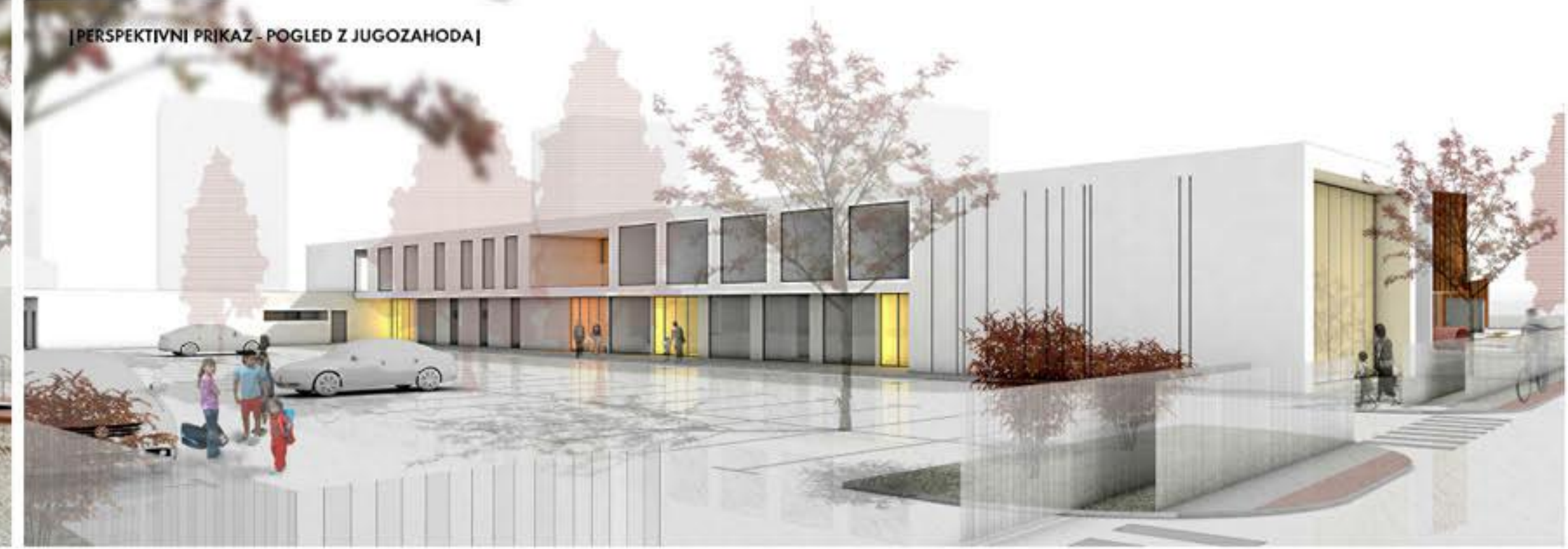
[PERSPEKTIVNI PRIKAZ - POGLED Z JUGOZAHODA]