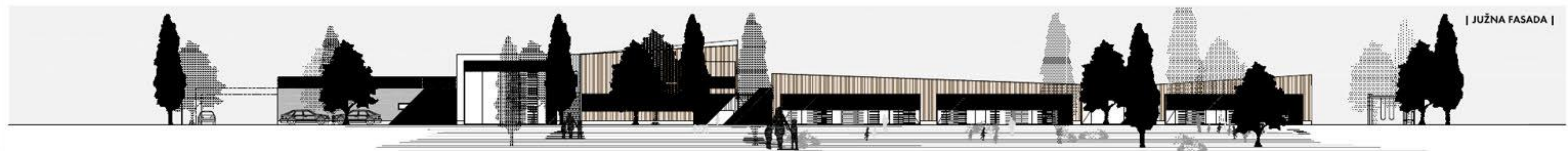
| JUŽNA FASADA |