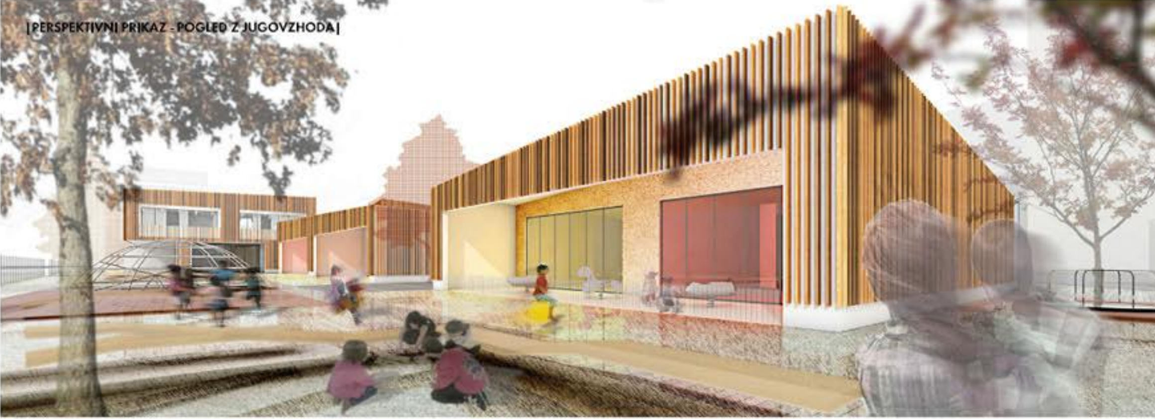
[PERSPEKTIVNI PRIKAZ - POGLED Z JUGOVZHODA]