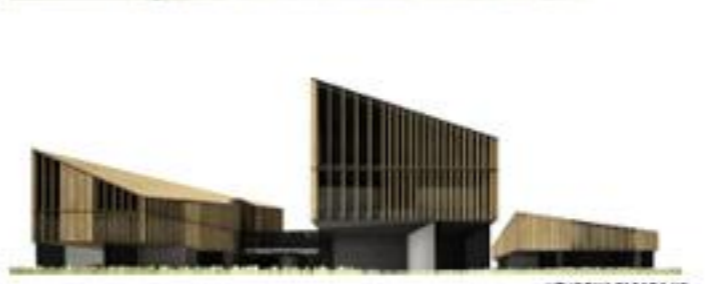
VHOVNA PASADA KC