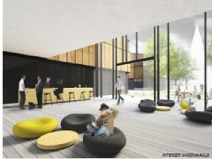
INTERIER VHOVNA AVLA