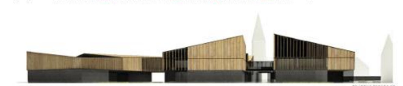
ZAHODNA PASADA KC