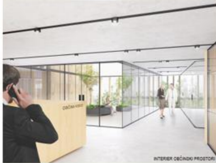
INTERIER OBCINSKI PROSTOR