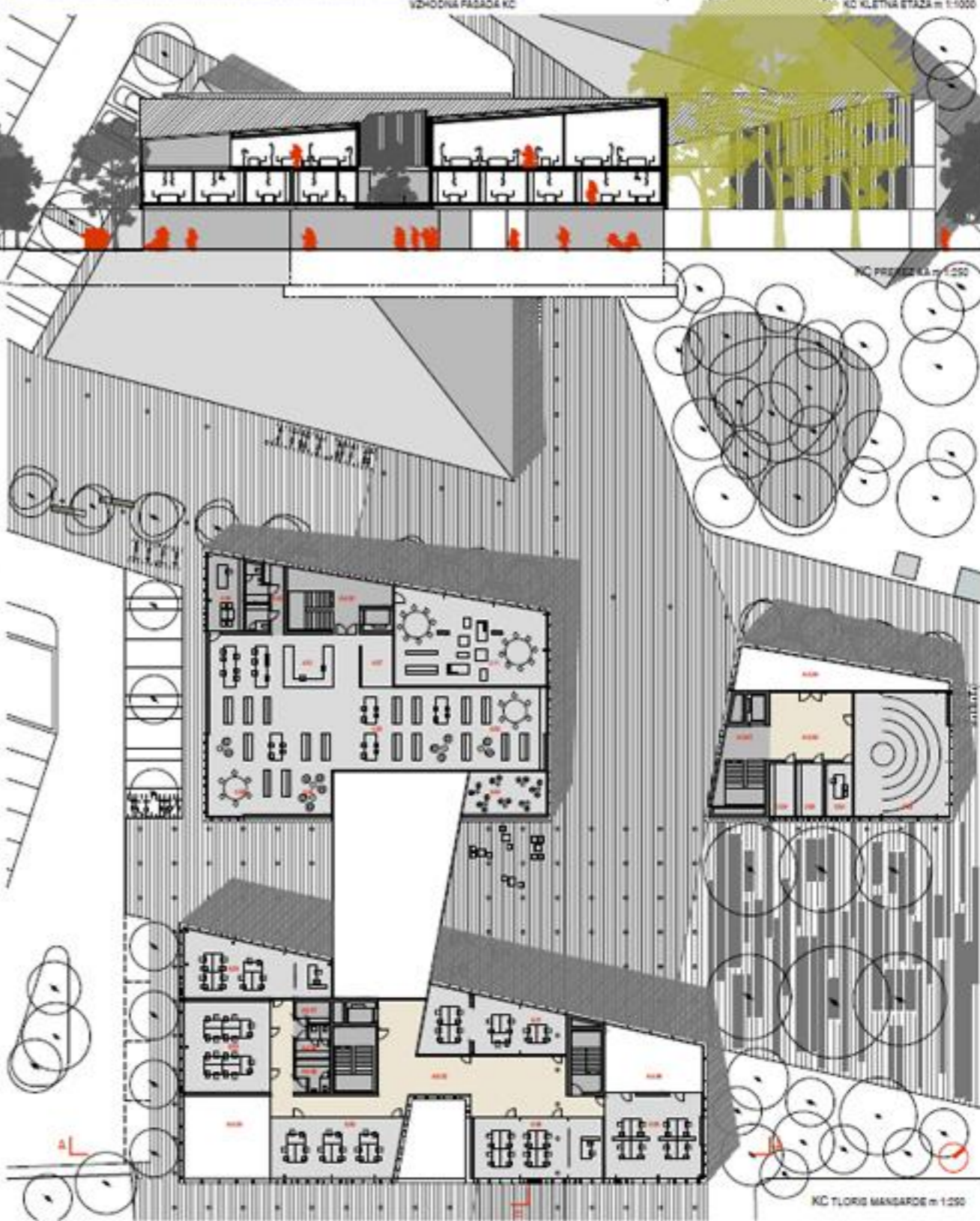
KC TLOVIS MANDARDE m 1:250