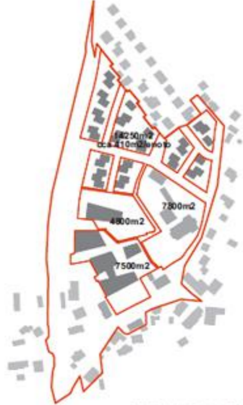
PARCELACIJA IN NAMENSKA RABA