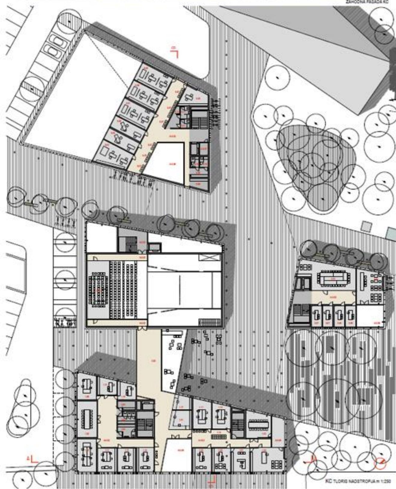
KC TLOVIS NADSTROPJA m 1:250