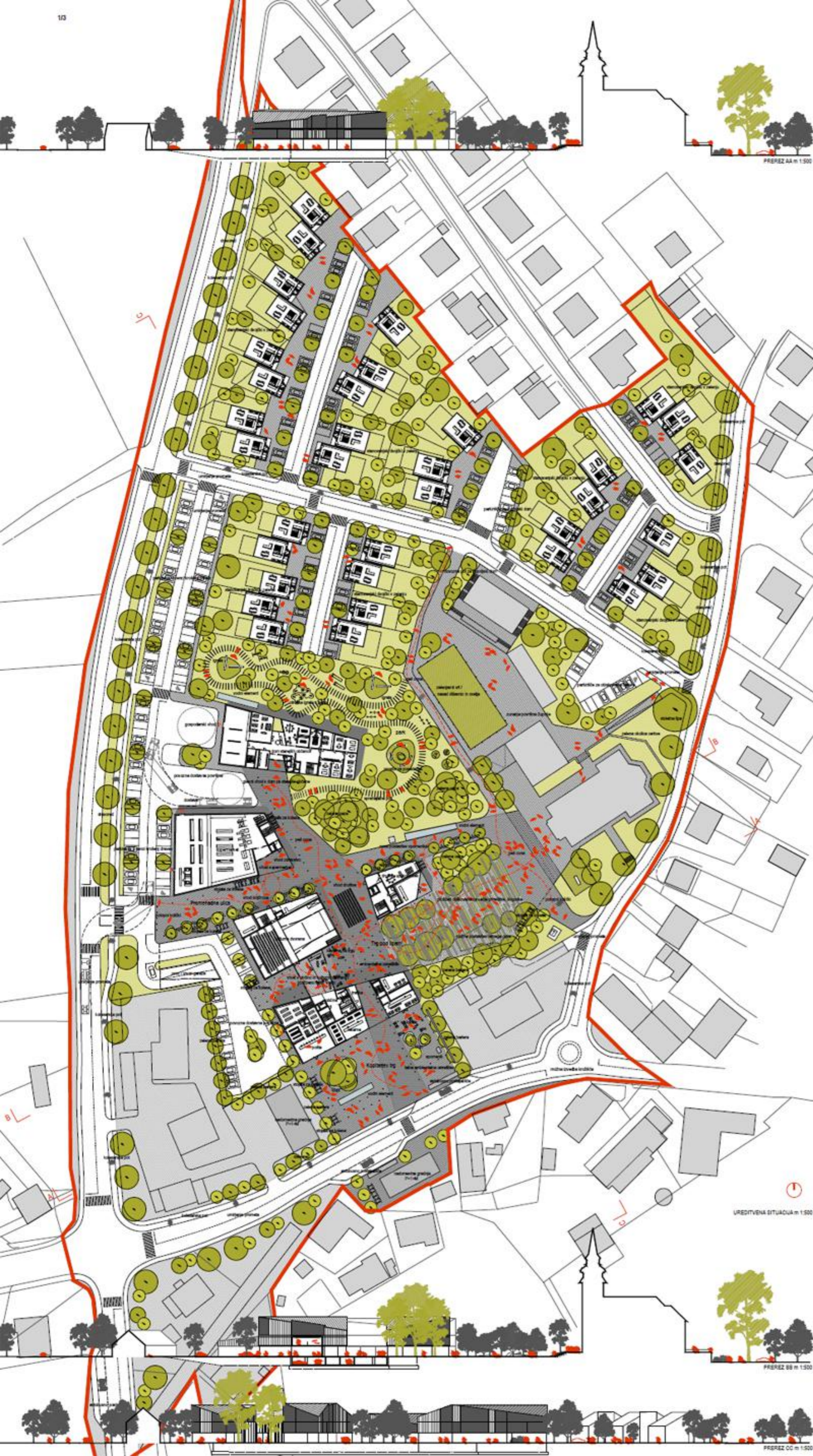
PREREZ AA n 1:500