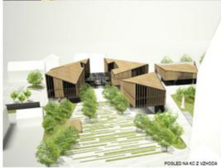
POSLED NA KC Z VHOZA