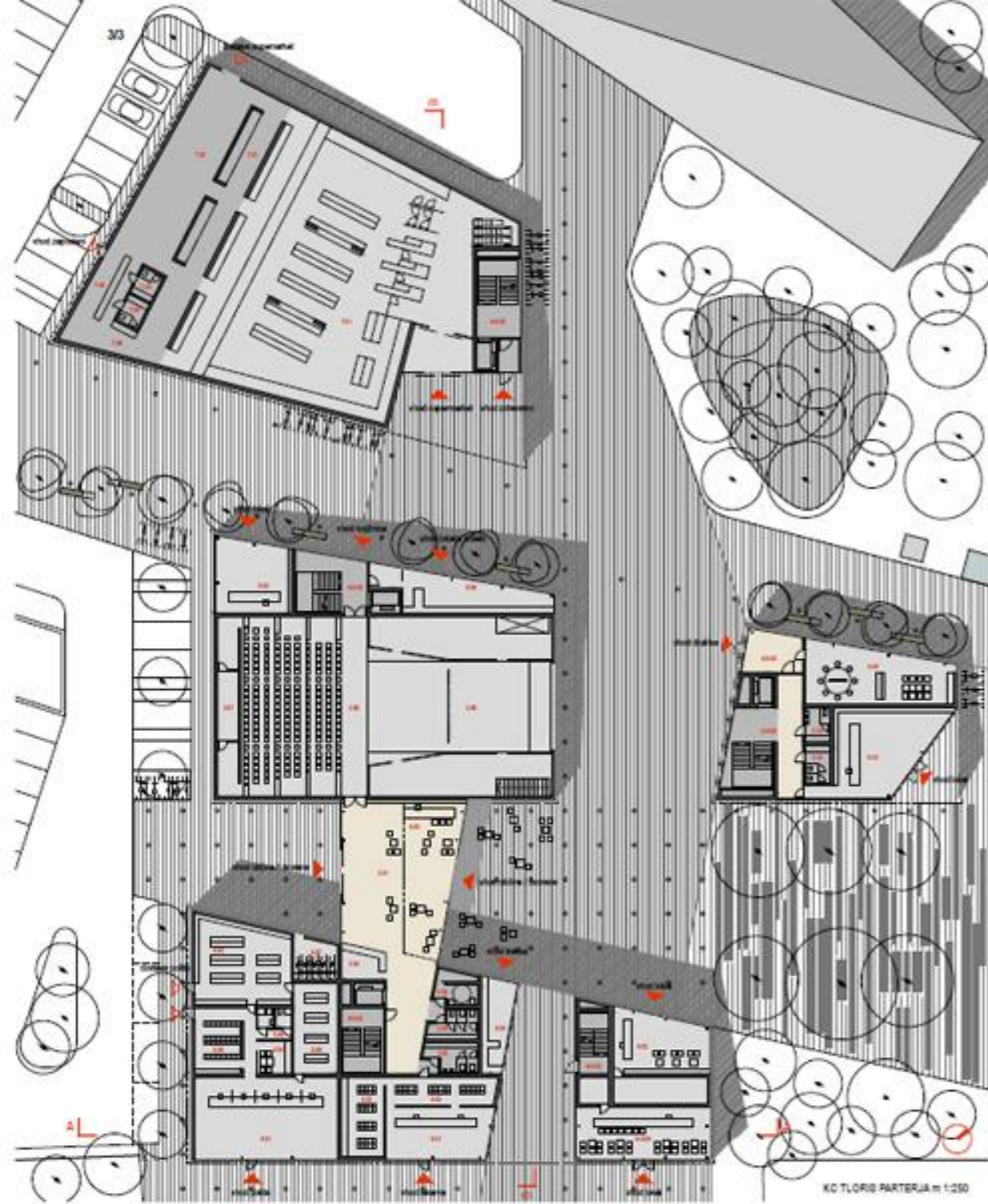
KC TLOVIS PARTERJA m 1:250