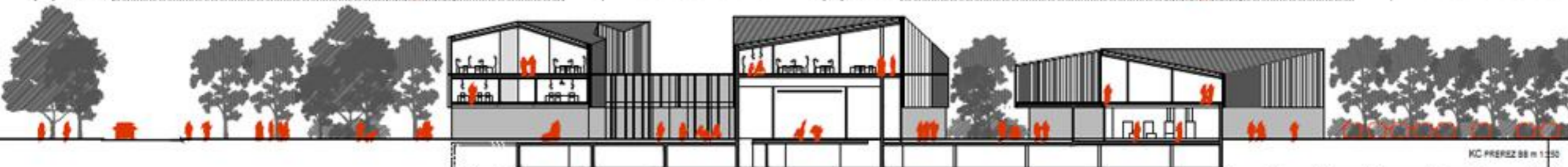
KC PRESEZ 88 m 1:350