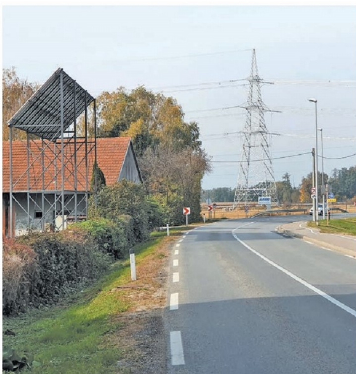
Domačini stolp v Noršincih zaradi izjemnih dimenzij imenujejo po pariškem Eifflovm stolpu.