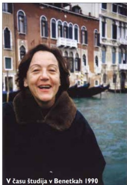
V času študija v Benetkah 1990

Umetnostna zgodovinarica, konzervatorica, avtorica številnih strokovnih člankov in knjig, tudi dveh knjig o umetninah, slikah beneških mojstrov, ki so jih, da bi jih zaščitili pred vojnim uničenjem iz Izole, Pirana in Kopra, odnesli v Italijo. In tam so ostale do danes. Sedemnajst let je posvetila temu problemu, zdaj so na vrsti drugi, pravi.