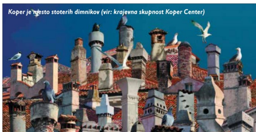
Koper je mesto stoterih dimnikov

Ob odkrivanju lepote in zanimivosti mestnega jedra Kopra ostanejo dimniki velikokrat spregledani. Po vzoru Benetk se na koprskih strehah skriva pravo malo arhitekturno bogastvo . Mestno tkivo nekoč glavnega mesta pomorske republike je tako gosto, da le redko ponuja široke panorame, namesto tega pa izstopajo oblike dimnikov.