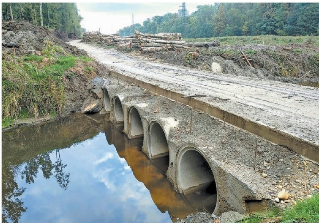
Most so zgradili na rokavu Mure, ki se imenuje Murica in spada pod okrilje Nature 2000 oziroma evropskega omrežja posebnih varstvenih območij, razglašeni v državah članicah Evropske unije, z osnovnim ciljem ohraniti biotsko raznovrstnost.