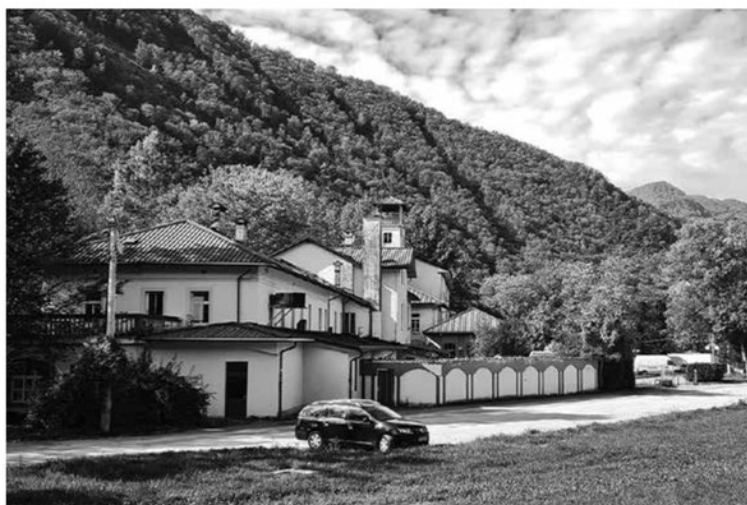
DELOVNA SKUPINA ZA OBLIKOVANJE SMERNIC ZA UREJANJE IN NADALJNI RAZVOJ SOTOČJA se prednostno ukvarja z ožjim območjem objekta nekdanjega hotela Paradiso z okolico, zaradi strateškega pomena lokacije pa išče tudi rešitve za širše območje s Sotočjem ter dostopom in povezavo do Tolmina in nemške kostnice.