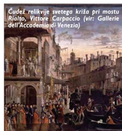
Čudež relikvije svetega križa pri mostu Rialto, Vittore Carpaccio

B eneško posebnost so upodobili celo slikarji, med njimi tudi Vittore Carpaccio, ki je zadnje desetletje preživel in ustvarjal v Kopru, v sliki "Čudež relikvije svetega križa pri mostu Rialto", kjer prevladujejo značilne oblike prisekanega stožca ali zvona.