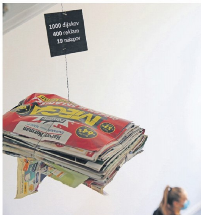
Največ reklamnih letakov prejmemo na dom, je pokazala mini dijaška raziskava.