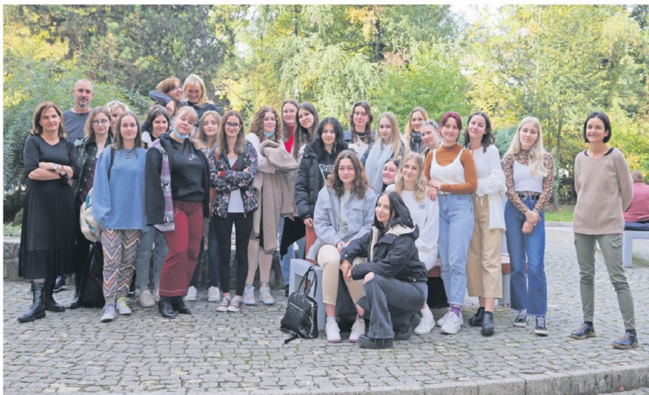
Letošnja ekipa Enajste šole pod mostom