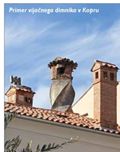
Primer vijačnega dimnika v Kopru