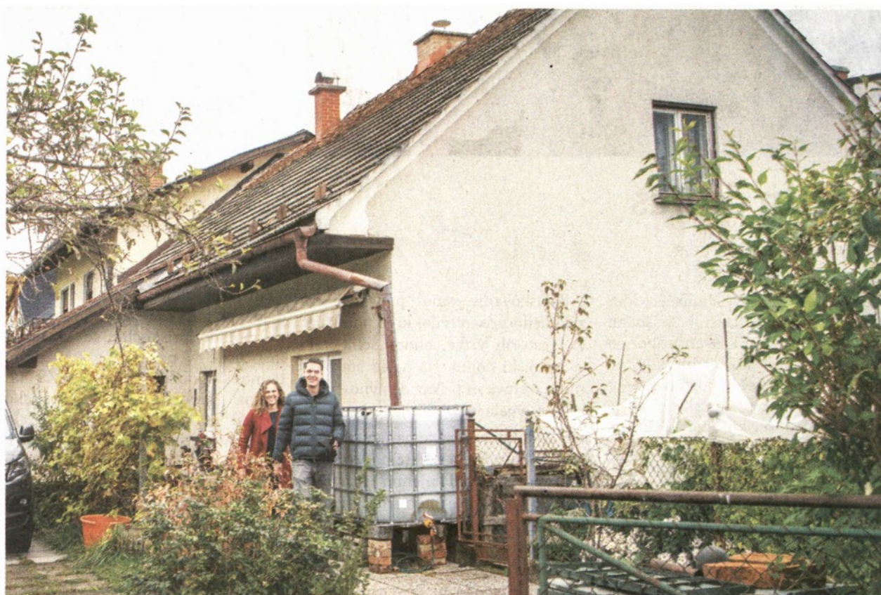
Projekt Hiša brez odpadkov, bi lahko kmalu oživel