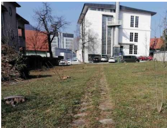
Slika 6: Pogled proti zahodu z obstoječo tlakovano potjo