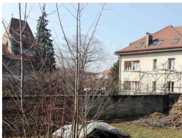
Slika 8: Pogled na južno stran natečajnega območja