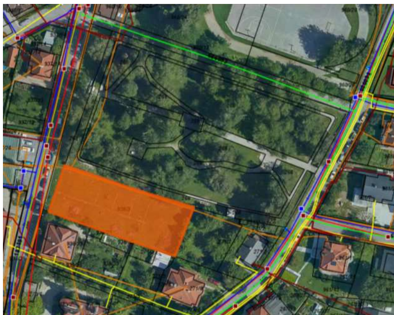
Slika 9: GJI (legenda: oranžna črta označuje telekomunikacije)

Dostop do natečajnega območja je z zahodne (SZ) smeri, z Gregorčičeve ulice, ki je javna pot, ob kateri je urejeno enostransko parkiranje. Natečajniki naj se opredelijo do parkirišč v izteku natečajnega območja, predvidijo lahko njihovo ukinitvev.