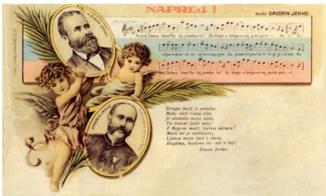
Slika 1: Razglednica "Naprej!" avtorjev Simona Jenka (pisec besedila) in Davorina Jenka (uglasbitev)

Besedilo pesmi »Naprej!« oziroma »Naprej zastava Slave« je bilo prvič objavljeno decembra 1860 v Slovenskem glasniku. Pesem je kmalu obkrožila ves slovanski svet in tudi del drugih evropskih narodov (Mrak, 2013).