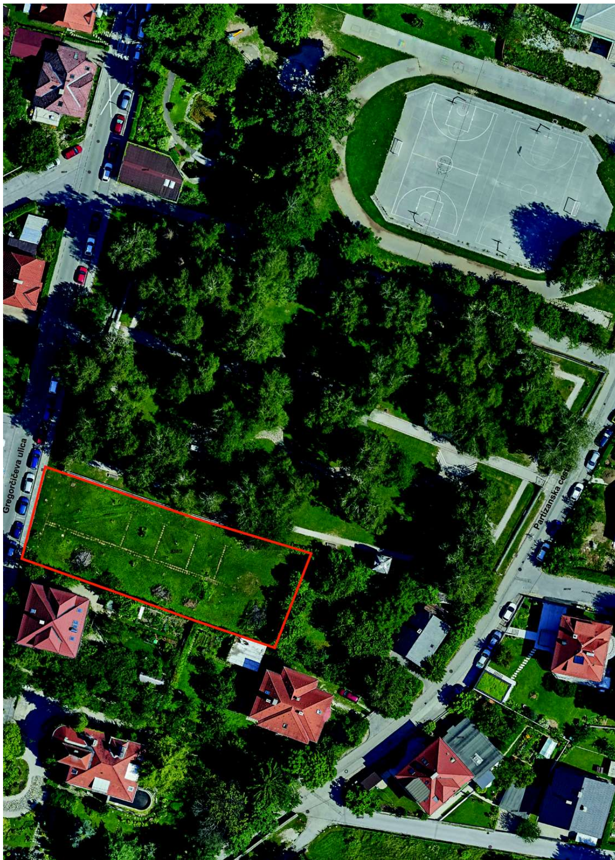
Slika 3: Natečajno območje; legenda: natečajno območje določa rdeča črta.

Natečajno območje obsega zemljišči s parc. št. 938/3 in del 268 (obe k. o. Kranj).