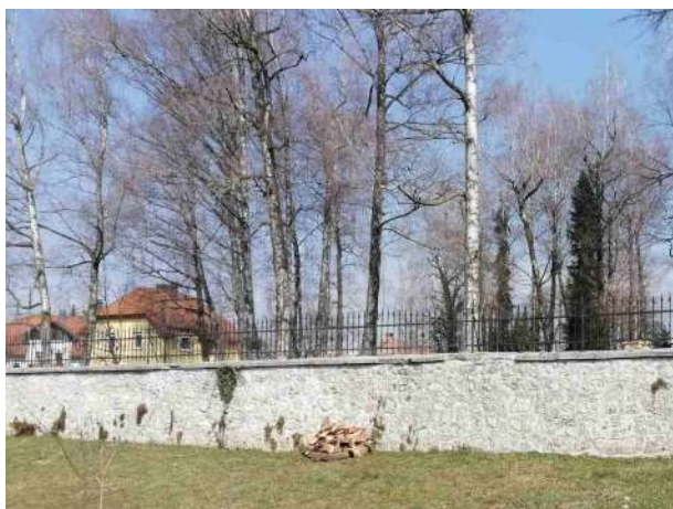
Slika 7: Pogled proti severu in Prešernovem gaju