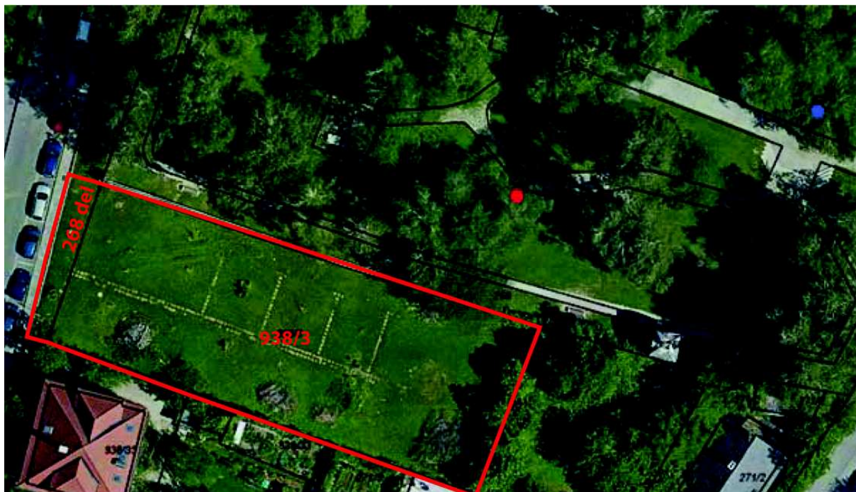
Slika 4: Prikaz obravnavanega območja z označenima lokacijama grobov Prešerna (modra pika) in Jenka (rdeča pika) v Prešernovem gaju

Območje obdelave so zemljišča s parc. št.: