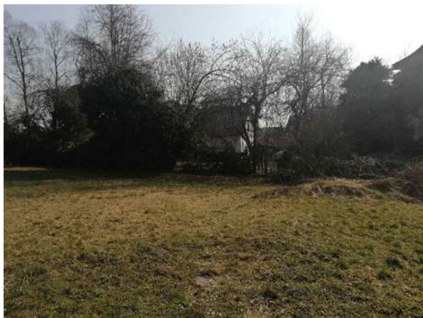
Slika 5: Pogled iz osrednjega dela proti privatnemu objektu na vzhodni strani

Prikaz trenutnega stanja na natečajnem območju: