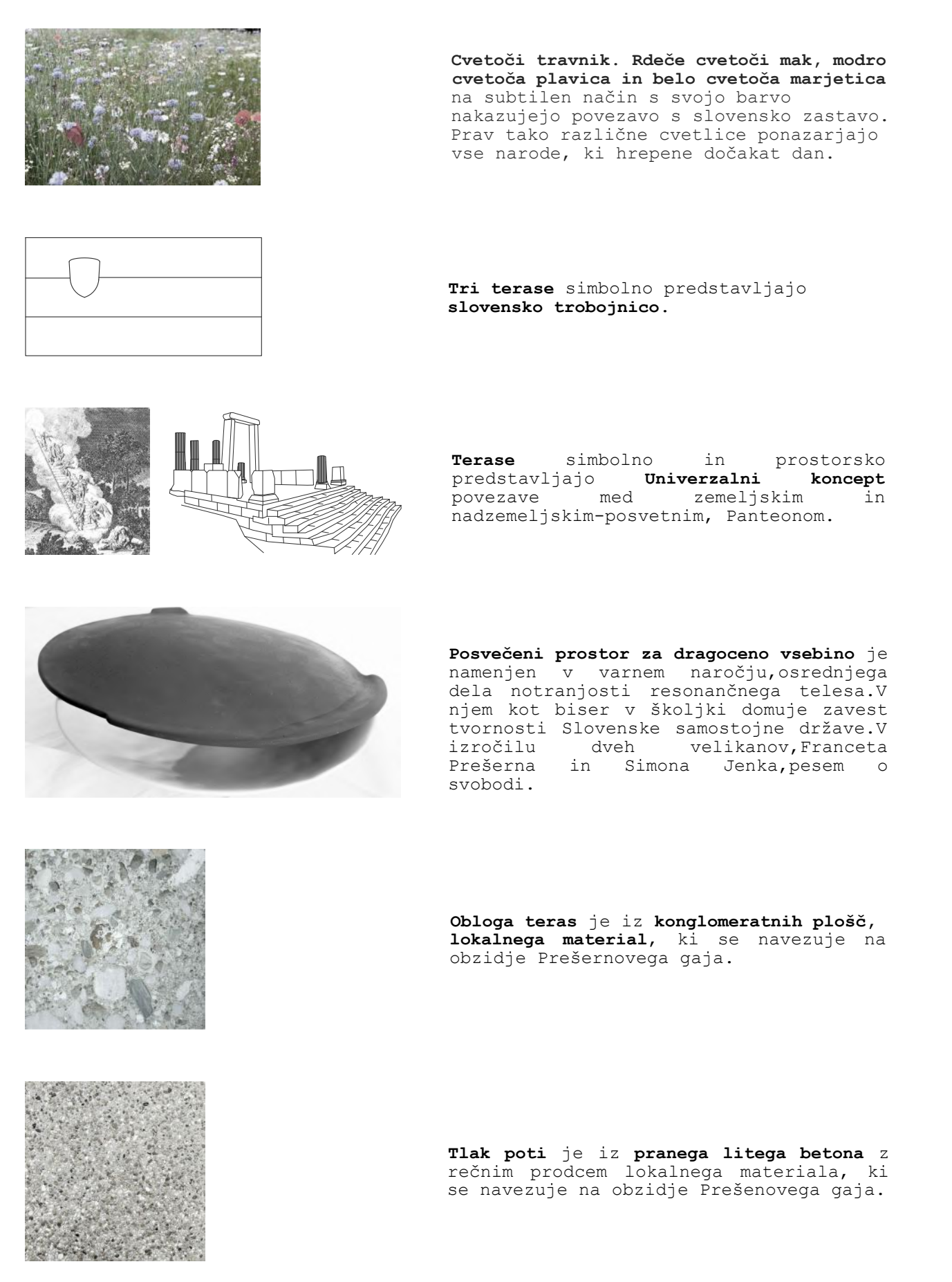
HEME IN RAZLAGE