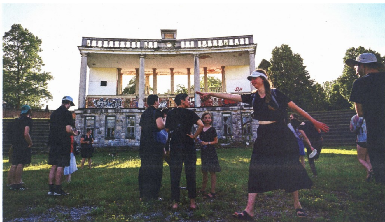
Restavratski center je analiziral stanje Plečnikovega stadiona in ugotovil, da je dobro ohranjenega 53 odstotkov. A opozoril je, da se zaradi načetosti materialov in pomanjkljivega vzdrževanja njegovo stanje hitro slabša.