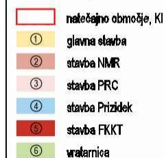
Obstoječi objekti KI