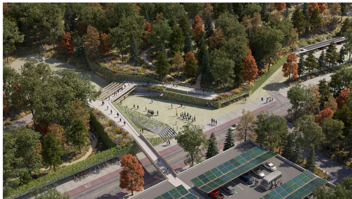
Umetna krajina, naravni prag

Živalski vrt je umetno ustvarjen naravni prostor, ki gosti, razstavlja in varuje raznolike živalske vrste. Je ograjen prostor, ki čaka, da ga odkrijemo, zakladnica presenečenj. Obisk živalskega vrta je potovanje v naravo, pustolovščina, ki nas popelje iz vsakdanje mestne rutine v srečanje z divjino. Poslanstvo živalskega vrta je ohranjati raznolikost narave in očarati obiskovalce z njenim bogastvom, s čimer izraža njeno krhko lepoto in potrebo po njeni zaščiti. Živalski vrt bi moral biti zgleden prostor za interakcijo med človekom in njegovim